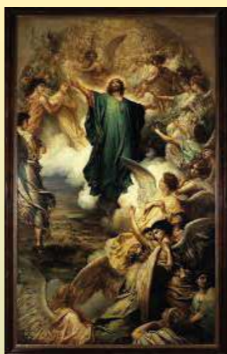
[Armand du Garreau]

Commencement du livre des Actes des Apôtres (1, 1-11)